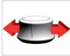
Bewegen nach rechts/ links

Zur Steuerung einfach die Controller-Kappe drücken, ziehen, drehen oder kippen.