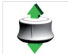
Schwenken nach oben/ unten